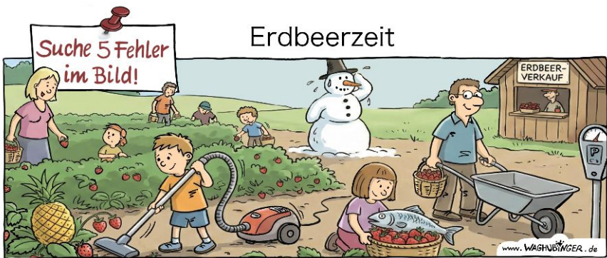
Ananas, Staubsauger, Schneemann, Schneemann, Fisch, Parkuhr